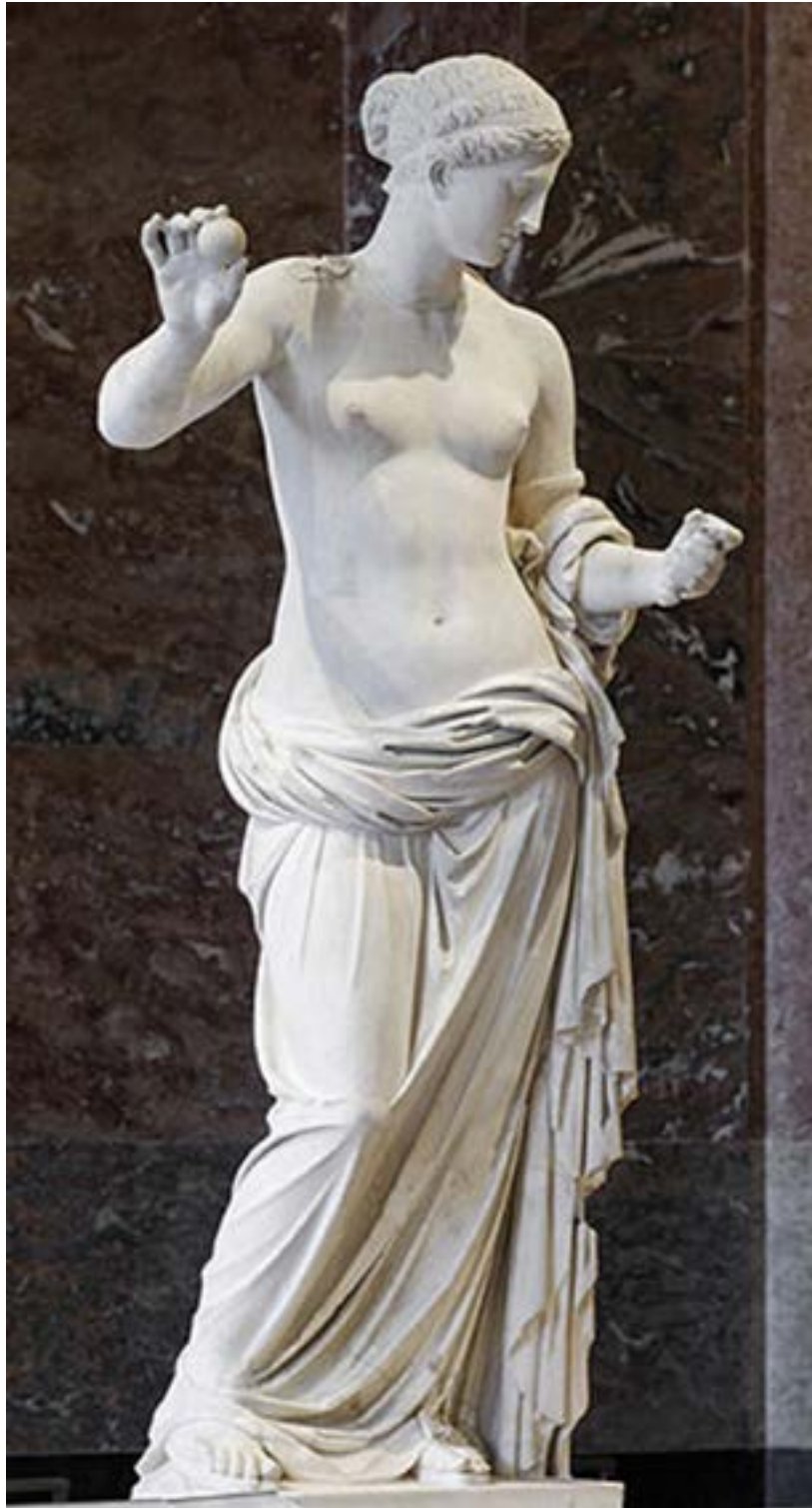
La Vénus d'Arles