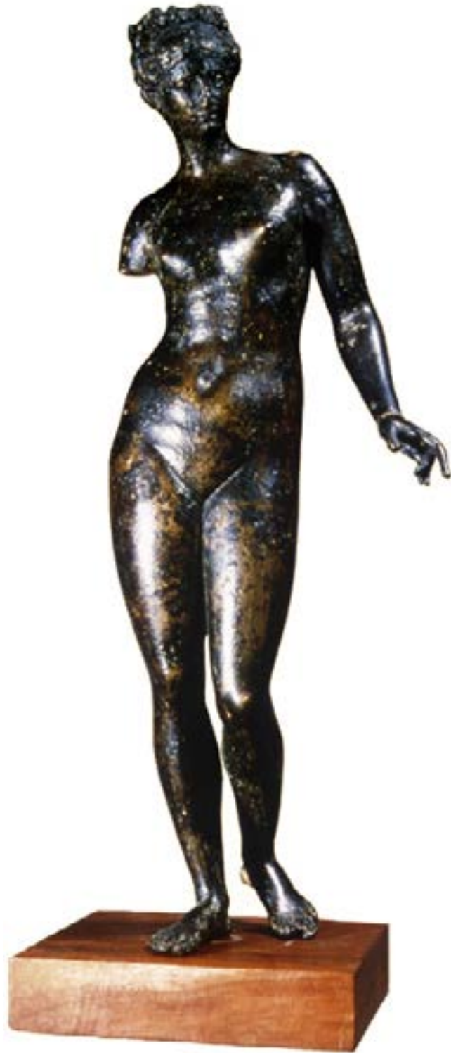
Vénus en bronze