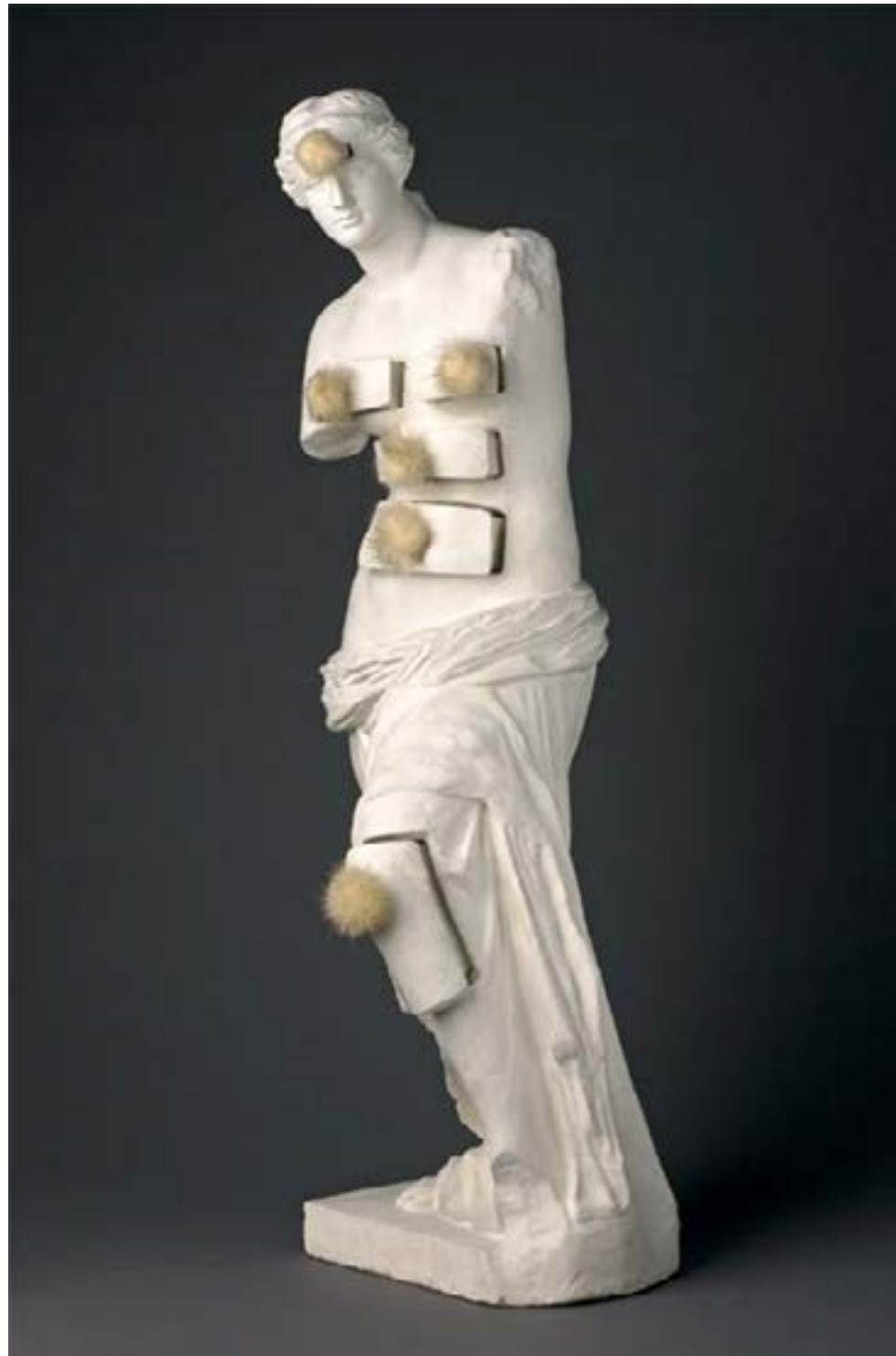
La Vénus de Milo d'après Salvadore Dali