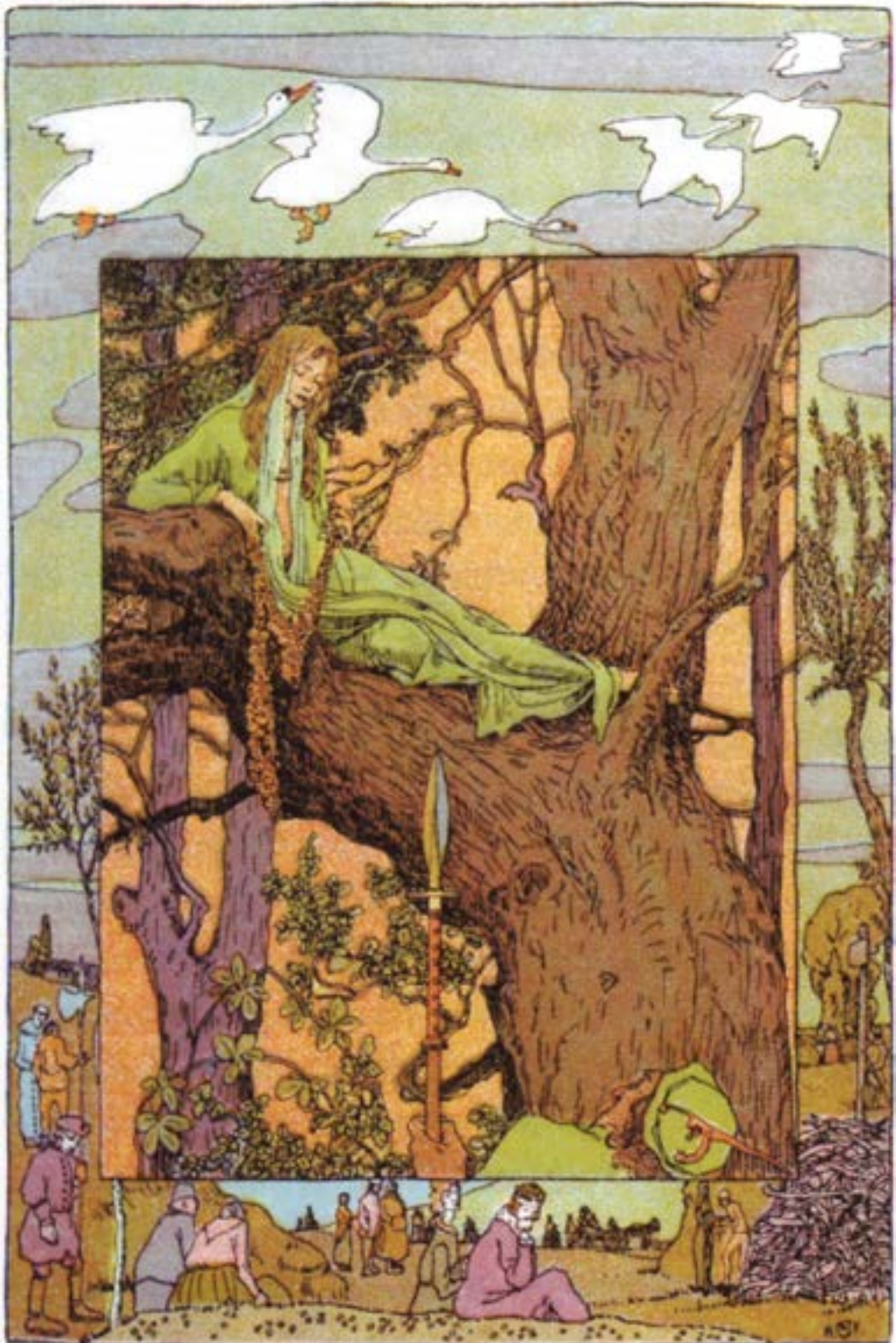
Les six cygnes