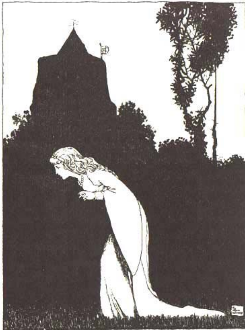
W. Heath Robinson

Mais elle avait peur de sa belle-mère et elle demanda au roi la permission de passer encore une nuit dans le château de la forêt.