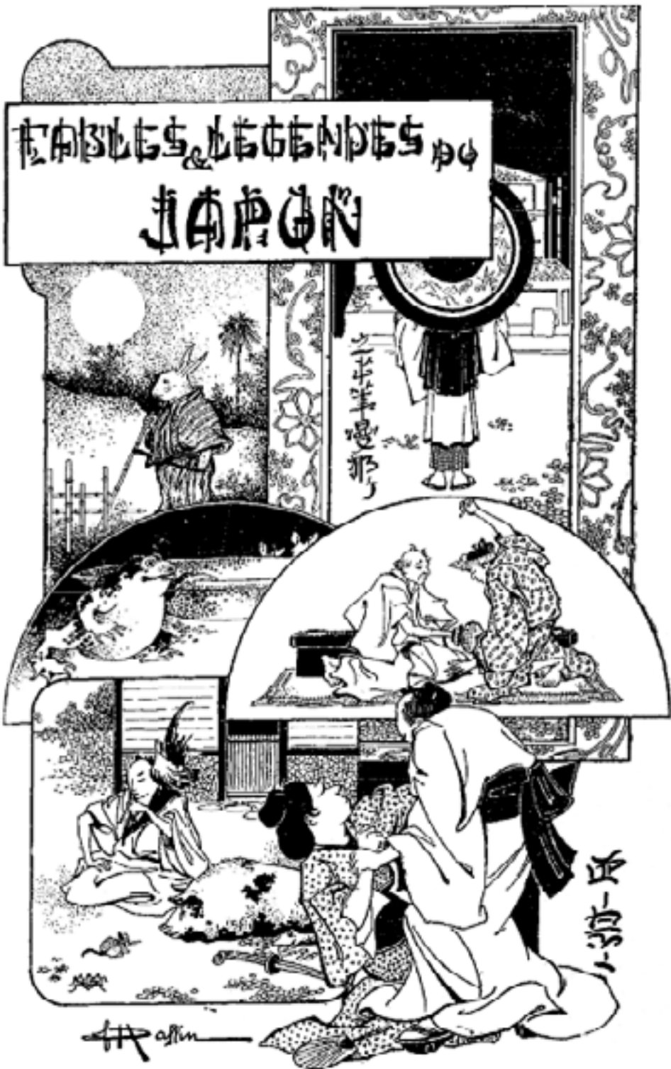
Les Rats au temple