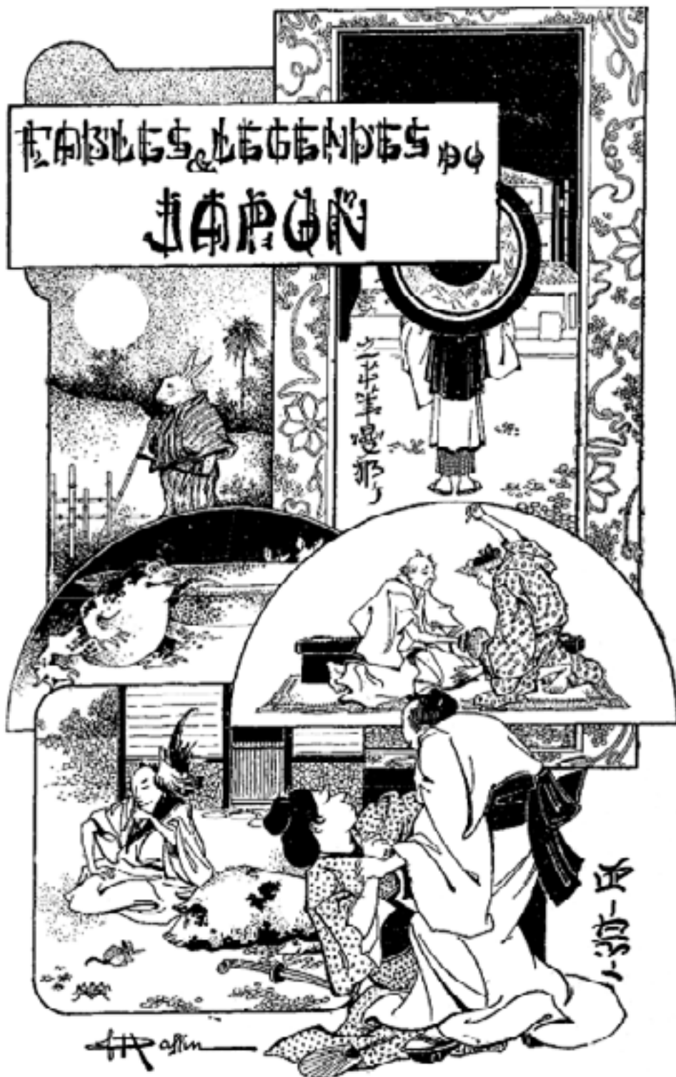
Ourashima Taro et la Déesse de l'Océan