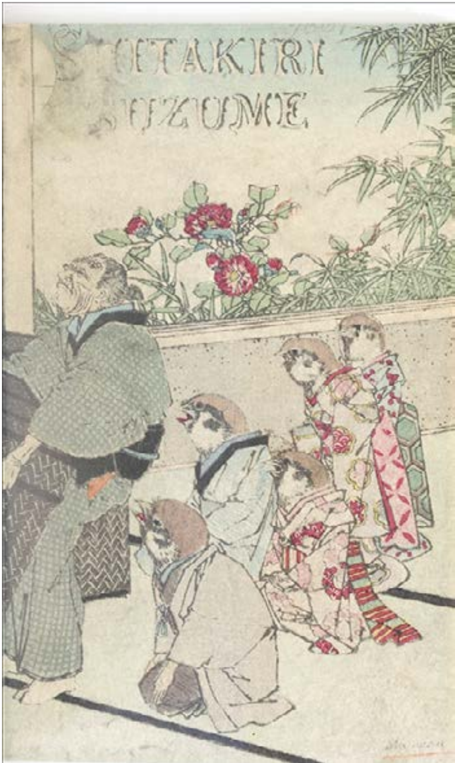
Le moineau qui a la langue coupée