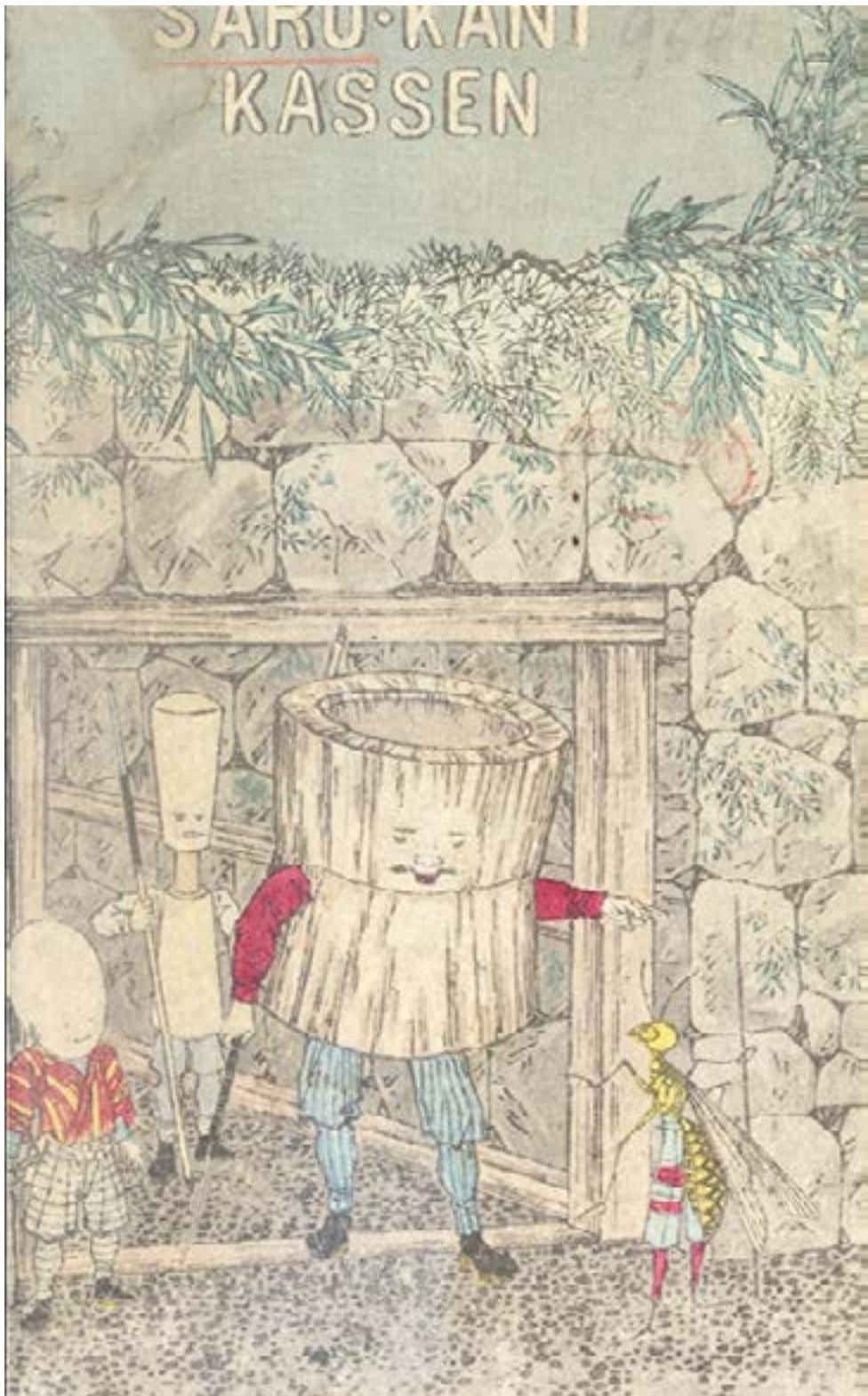
La bataille du crabe et du singe